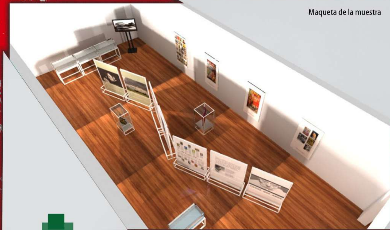
Maqueta de la muestra

Considerando los espacios y las necesidades de cada ciudad donde la muestra sea instalada, se ajustará en su armado, pero siempre la idea es poder visualizar la trayectoria de Yupanqui en al menos cinco aspectos: El Hombre – la obra – el mensaje – la proyección, el patrimonio cultural. Estas visiones permitirán dimensionar la vida y obra del homenajeado, tanto a quienes no lo conocen (los jóvenes y escolares especialmente), como también a sus seguidores.